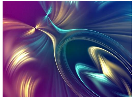
de Geest is uit de fles

Vanuit de optiek van hogere frequenties worden we dermate sterk omgeven door een electromagnetisch veld van licht en verfijnde vibraties dat het zo goed als zeker is dat het collectieve bewustzijn hierdoor aangeraakt en opgetild zal worden. Met zoveel licht in aantocht zullen velen de georkestreerde duisternis van de autoriteiten gaan doorzien. En met zoveel lichtimpulsen zal de duistere agenda van globalisme, die een oude wereldorde vertegenwoordigt, zijn greep op de mensen versneld verliezen. Als het licht toeneemt, neemt de duisternis af. De Geest is uit de fles.