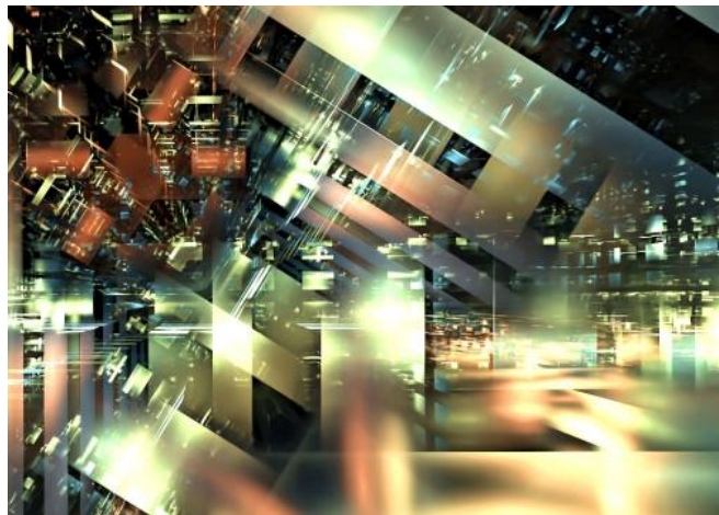
einde van een imperium

Als de samenleving niet ingestort is, wie of wat dan wel? Het is de 1% die, hoewel nog niet in de etalage, op zijn gat ligt. De kleine groep van superrijken die de bevolking al jaren lang uitmelkt, onder de duim houdt en zand in de ogen strooit, heeft zichzelf opgeblazen. Of beter gezegd, hun imperium is geïmplodeerd. Over